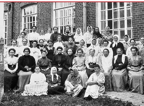
Служащие и больные IV и VI павильонов

Особое место в истории учреждения занимает больничный храм, расположенный на территории больницы. Он был построен на средства курского земства в 1902 году и с самого начала стал духовным центром лечебницы. Здесь пациенты и сотрудники находили утешение, поддержку и молитвенную помощь.