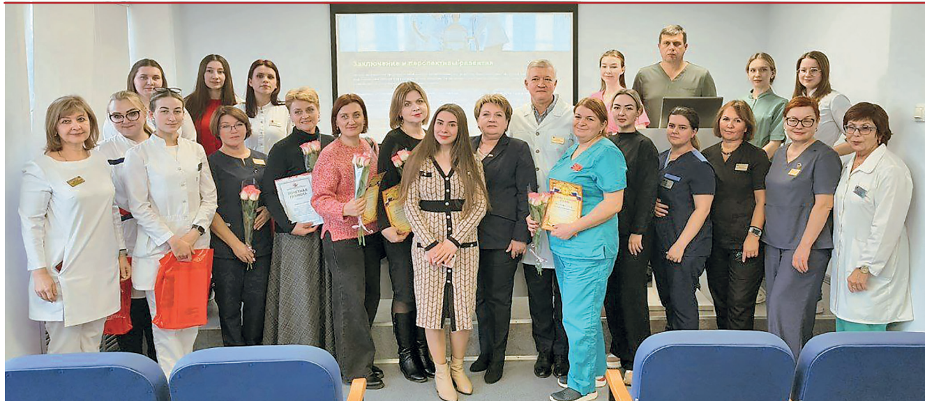
Наставники, врачи-стажеры и молодые специалисты БСМП

Минздрав России в ноябре текущего года представил проект Положения о наставничестве в сфере здравоохранения, который раскрывает порядок привлечения опытных врачей и медицинских сестер к курированию выпускников медицинских вузов и колледжей. Эта мера сопутствует норме закона, регламентирующей обязательную отработку молодыми специалистами в медицинских организациях (государственных и частных), которые предоставляют услуги в системе ОМС. В связи с этим школа наставничества получила новый импульс.