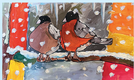
Тарасова Маруся, 8 лет, Курская городская поликлиника №5

Коллеги, с Новым годом! С новым счастьем! Здоровья и успехов вам в труде! И пусть исполнятся заветные желанья, Чтоб были вы удачливы везде!