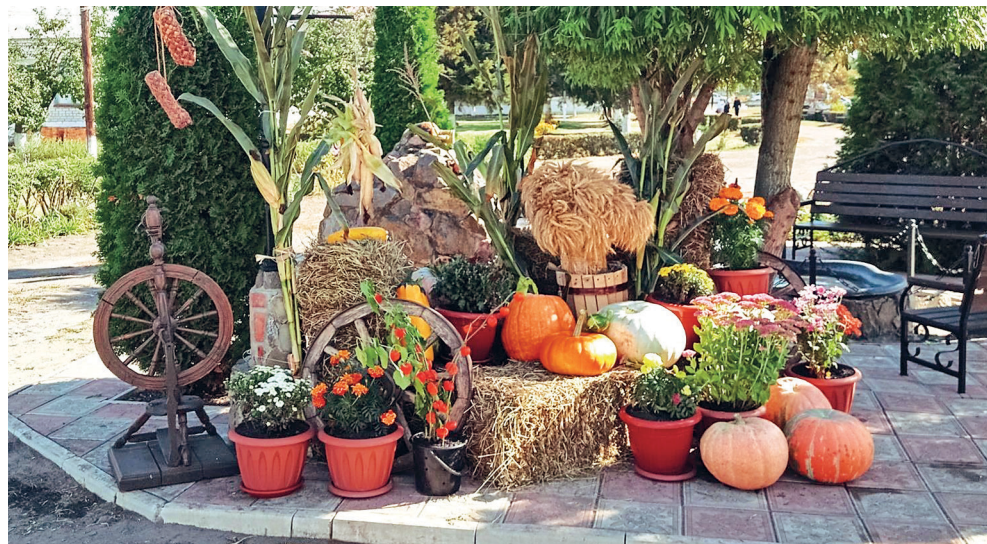
Осенняя композиция 2025. Автор и идейный вдохновитель этого и других этюдов – главный врач С.Н. Елфимова

районов. Выездная паллиативная бригада может приехать в экстренном порядке, если это необходимо (по вызову родных пациента), но обычно медсестра и врач навещают пациента по плану наблюдения. В составе бригады работают социальный работник и опытный психолог. Ежегодно бригада обслуживает от 230 до 250 вызовов.