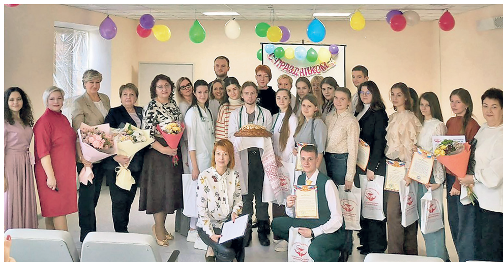
Курская городская больница №6. Торжественное посвящение в профессию молодых специалистов

заведующая физиотерапевтическим отделением, председатель первичной профсоюзной организации ОБУЗ «КГКБСМП».