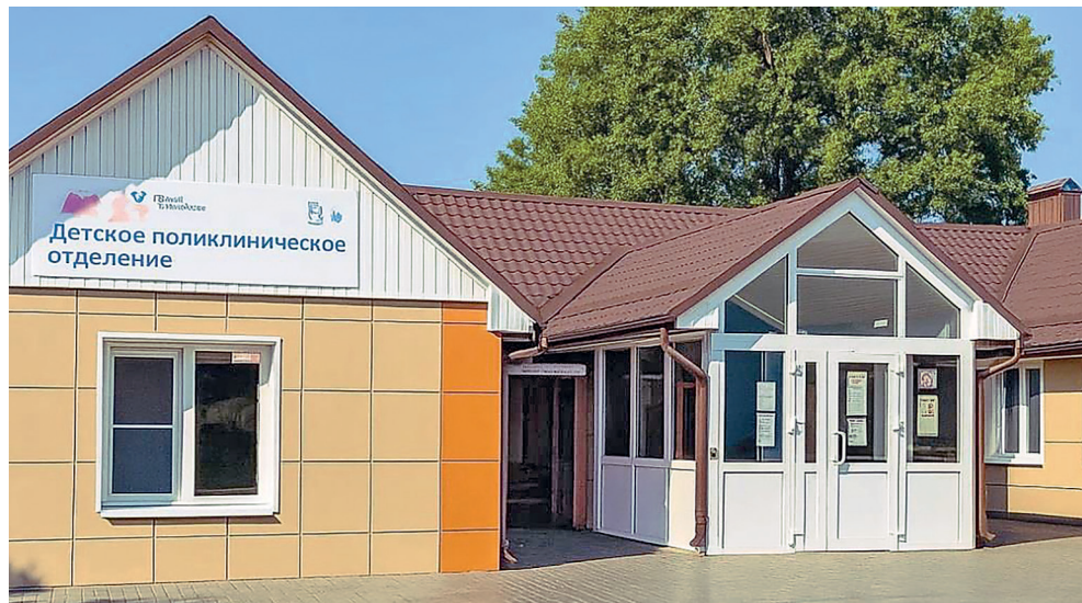
Детское поликлиническое отделение после ремонта