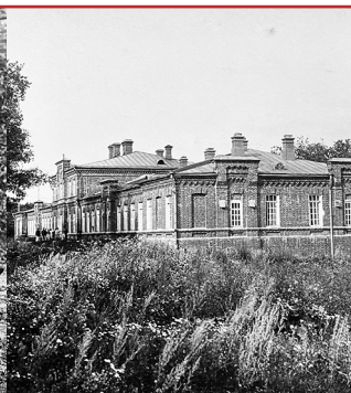
XII павильон для слабых мужчин и женщин