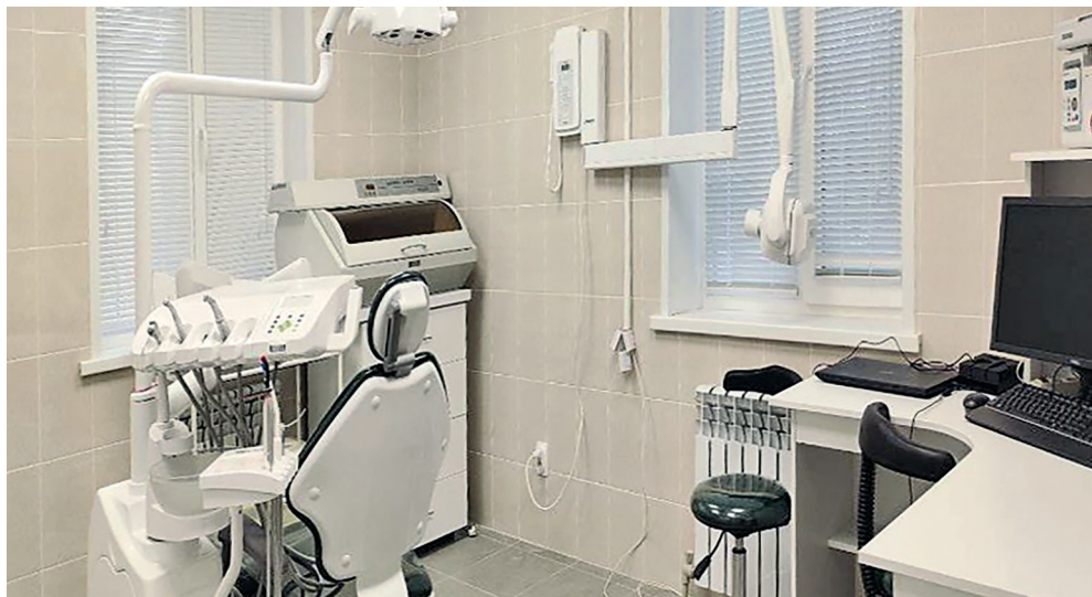
В новом детском стоматологическом кабинете установлено современное оборудование, которое маленьких пациентов не пугает