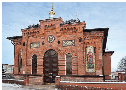
Храм святого великомученика и целителя Пантелеимона

Возрождение началось в 1990 году, когда храм был возвращен Курской епархии. С 2013 года приходом проводились комплексные работы по восстановлению святыни, внутреннему благоустройству территории. И 9 августа 2023 года, в день святого великомученика и целителя Пантелеимона, митрополит Курский и Рыльский Герман освятил восстановленный храм на территории психиатрической больницы в поселке Искра. Это событие стало символом духовного возрождения, напоминанием о неразрывной связи милосердия, веры и врачебного служения.