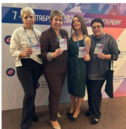
Санкт-Петербург, 2025 г. Мы на Всероссийском конгрессе «Качество в заботе о здоровье каждого»

Медицинские лабораторные техники перинатального центра – это специалисты высокого профессионального уровня и компетентности. Они не лечат пациентов, но от точности их исследований зависит жизнь людей. Лечащие врачи доверяют результатам лабораторных исследований. А это о многом говорит.