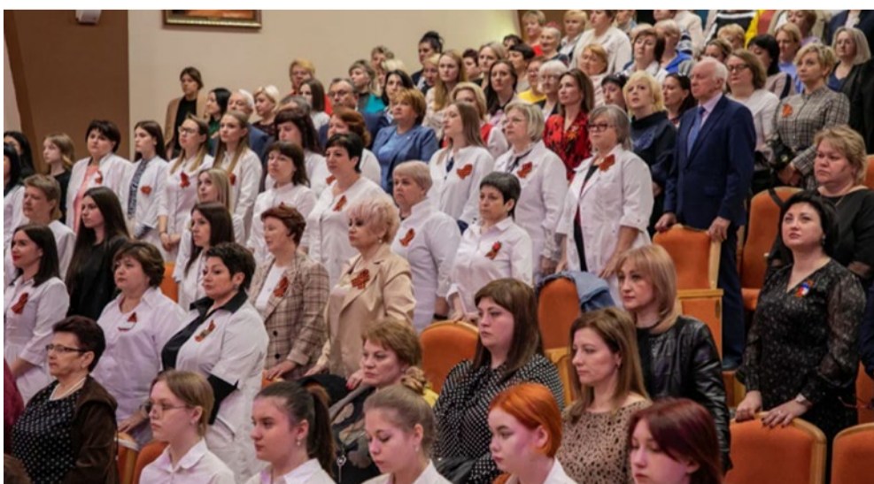
Участники областной конференции, посвященной Международному дню медицинской сестры, приветствуют ветеранов стоя. 2024 г.