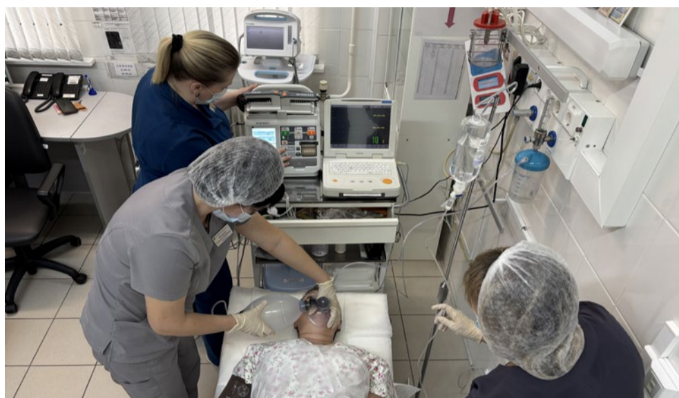
Оказание неотложной помощи в приемном отделении

Работа медицинской сестры гинекологического отделения – это в первую очередь рутинный труд, кропотливый и тяжелый. Здесь есть свои тонкости, необходимые в работе с пациентами. На первом плане –