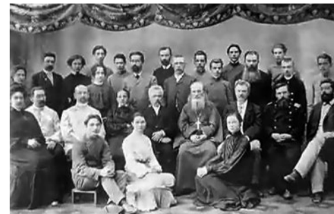
Первый выпуск Курской фельдшерской школы. 1902 г.

Практические навыки будущей работы наши студенты приобретают в ведущих курских клиниках. Четверть выпускников получают две квалификации. С 2023 года колледж участвует в пилотном проекте РФ по внедрению системы долговременного ухода