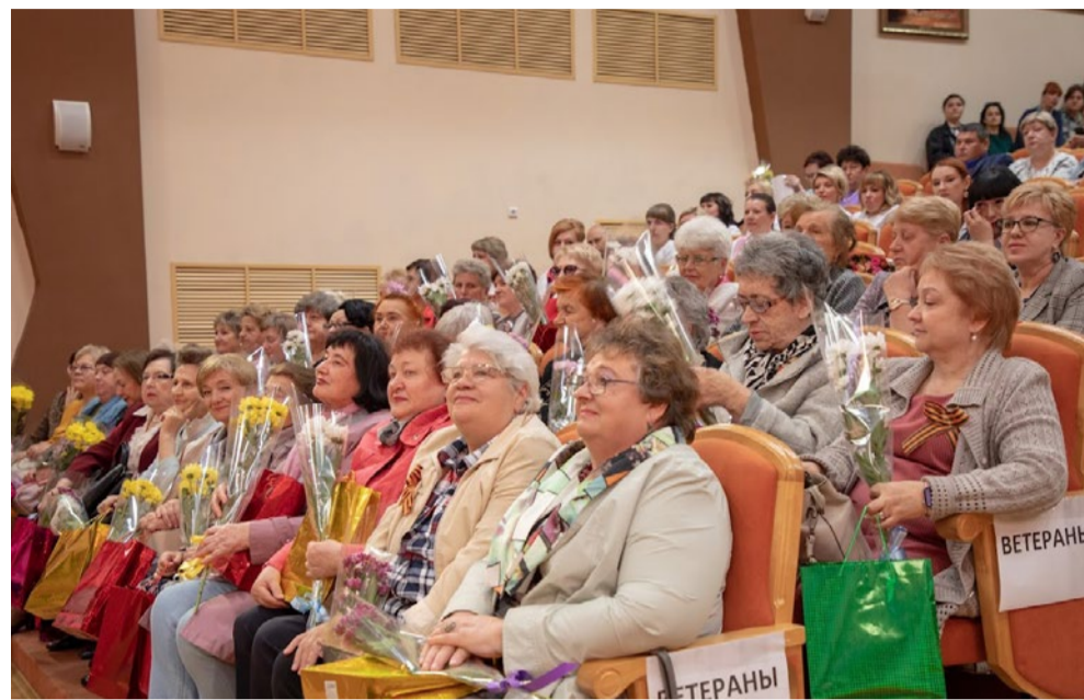
Ветераны сестринского дела

В настоящее время кадровая статистика в регионе по основным базовым должностям специалистов со средним медицинским образованием следующая: в медицинских организациях региона трудятся 8626 человек, из них 6123 медицинские сестры, 901 фельдшер, 321 акушерка и 549 лаборантов. Курская региональная сестринская ассоциация объединяет в своих рядах более четырех тысяч членов. Это 50% от числен-