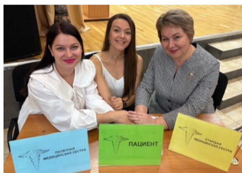
Мои коллеги – молодые и перспективные

этическая составляющая. От качества выполнения манипуляций и процедур до операций и в послеоперационном периоде во многом зависит качество лечения и жизни пациентов. Всесторонний уход за пациентом, различные диагностические и лечебные процедуры – всё это и многое другое лежит на хрупких плечах медсестры. Человек, поступивший в стационар, порой испытывает стресс, начинает «теряться». В такой ситуации важно внимание, сострадание и милосердие медицинской сестры.