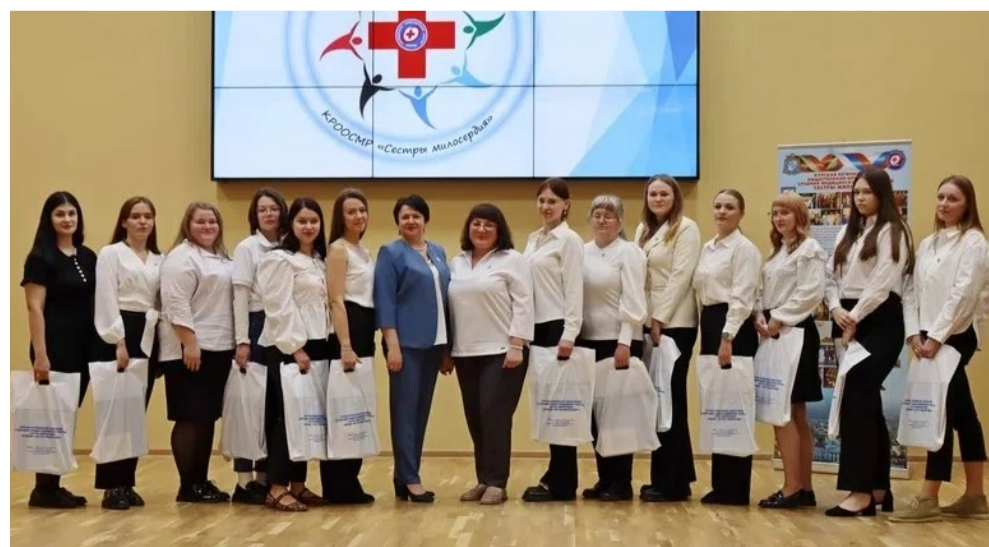
Молодежный Совет КРООСМР. Научно-практическая конференция «Адаптация молодых специалистов в практическом здравоохранении». Сентябрь 2025 г.