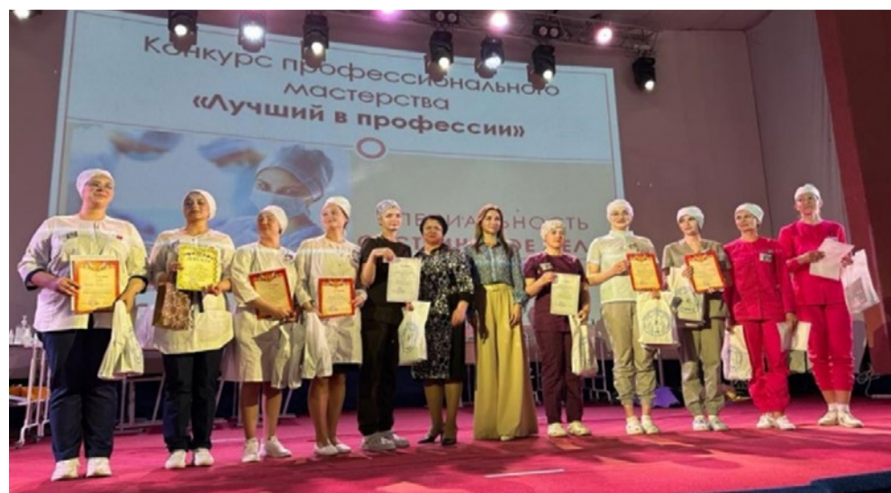
Конкурс профессионального мастерства среди студентов медицинских колледжей. 2023 г.