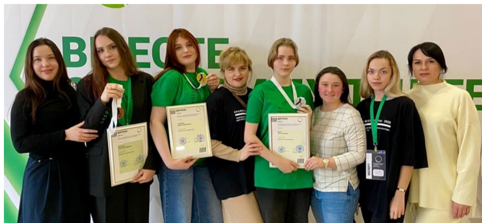
Наставники и участники чемпионата «Профессионалы»

К пробуждению, воспитанию и укреплению этих и других важных качеств в медицинском работнике Курский медколледж имеет непосредственное отношение. Ведь мы ведем подготовку высококвалифицированных медицинских специалистов среднего звена с августа 1898 года, когда при Курской губернской земской больнице открылась фельдшерская школа.