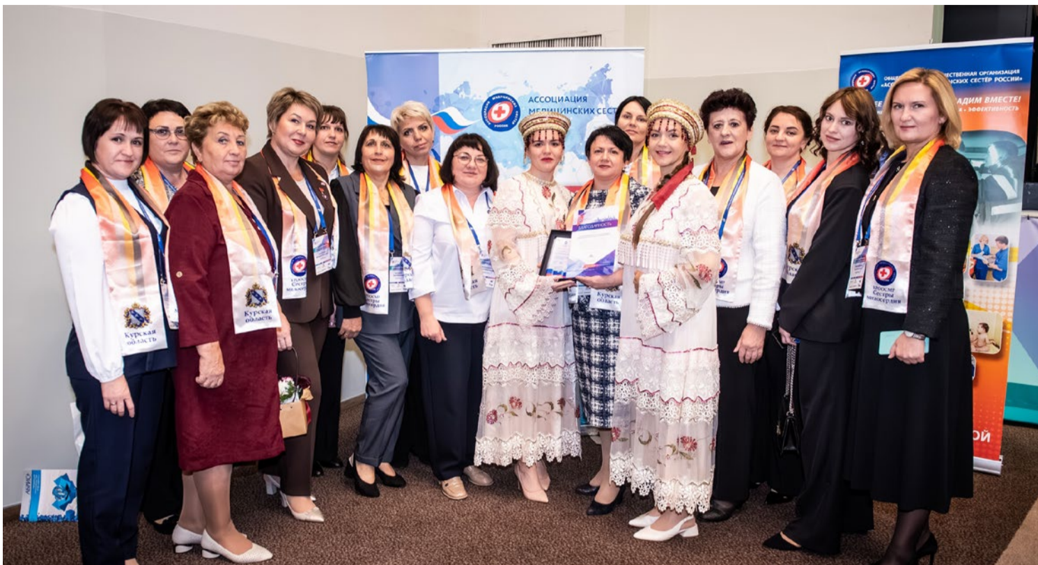
Делегация Курской области на Всероссийском конгрессе РАМС в Санкт-Петербурге. Октябрь 2025 г.

КРООСМР «Сестры милосердия» тесно сотрудничает с кафедрой сестринского дела Курского государственного медицинского университета, Курским базовым медицинским колледжем и медико-фармацевтическим колледжем КГМУ. Совместно проводятся различные образовательные мероприятия и профессиональные конкурсы.