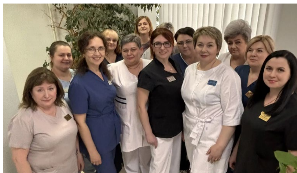
Мы – команда!