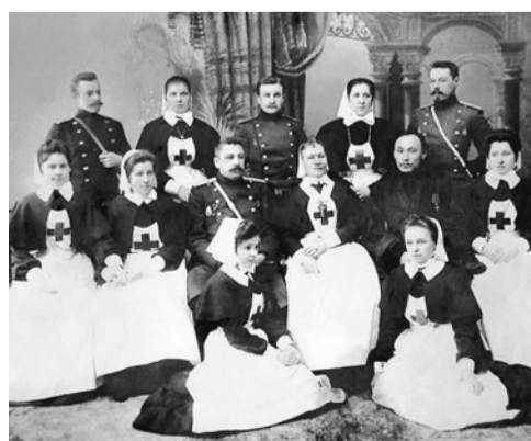
Сестры милосердия. XIX век